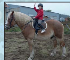
Ale není to takto přece jen lepší?

Tyto poukazy můžete zakoupit v prodejně „Podlahové studio“ v Břeclavi na ulici Jungmannova 1, po-pá 9 – 17 h, další prodejní místa najdete na stránkách www.jkpostorna.com , nebo Vám je sdělíme na tel. 777 168 884 . Cena jednoho poukazu je 200,-Kč a lze ho rozdělit třeba na ½ pro dvě děti.