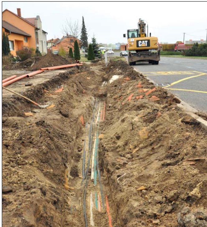
I chodník na ulici Lednická získal díky rozsáhlé opravě kvalitnější povrch.

du také byla dokončena rekonstrukce chodníku na ulici Lednická, opravuje se parkoviště na ulici Budovatelská, před dokončením je I. etapa komunikace k MŠ U Splavu. Hotová je i oprava povrchu místní komunikace na ulici Obránců míru. „Na mnoha investičních akcích se přitom městu podařilo díky výběrovým řízením ušetřit desítky či stovky tisíc korun, v případě regenerace sídliště Slovacká dokonce polovinu z původního