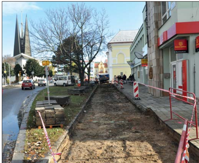
Opravou povrchu prochází chodníky na náměstí.

Také v listopadu břeclovská radnice pokračovala v opravách města. Kromě rozsáhlé regenerace sídliště Slovacká, o které jsme vás informovali v minulém čísle Radnice, je před dokončením předláždění chodníků na náměstí T. G. M.. Zvýšený komfort tak poskytnou chodcům chodníky v prostoru před bývalou prodejnou Rossmann, i chodníky na protější straně (tedy v prostoru před sídlem České pojišťovny). V listopa-